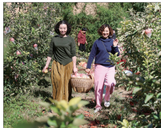
游人提着刚采摘的苹果