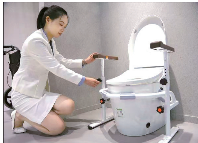
今年进博会上展示的可调高度的马桶扶手