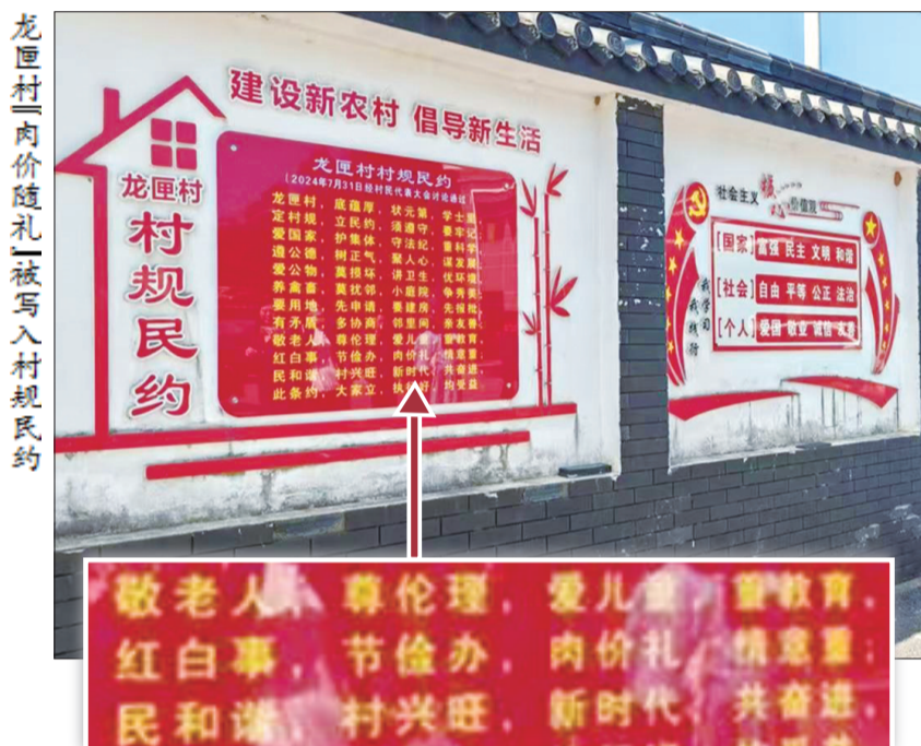
龙匣村“肉价随礼”被写入村规民约

近日#湖南一村庄酒席流行一斤肉价随礼#登上各大平台热搜榜，引发网友热议。据悉，这一随礼风俗在湖南省株洲市茶陵县高陇镇龙匣村盛行，在村民办酒席时，乡亲们按当下一斤肉的价格，折现送上礼金。