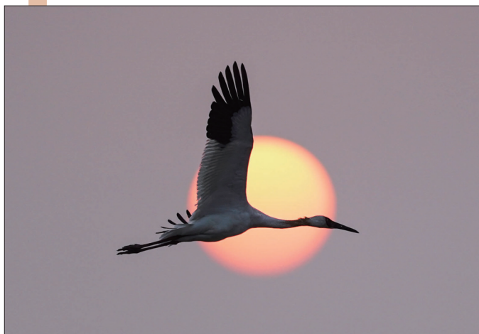
一只白鹤在南昌高新区五星白鹤保护小区翱翔。时值初冬,江西鄱阳湖区迎来大批越冬候鸟。在南昌高新区五星白鹤保护小区,成群的白鹤、天鹅等候鸟与落日余晖交错,美不胜收。