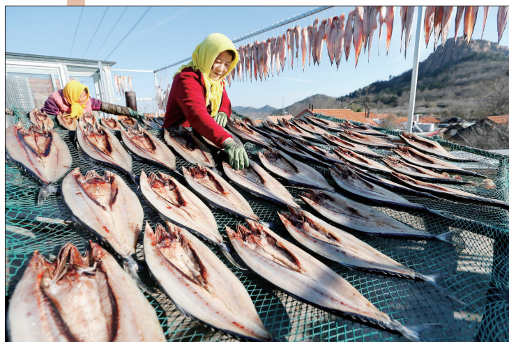
12月3日,山东省青岛市即墨区鳌山卫街道垛石村的渔民在晾晒鱼干。初冬时节,山东省青岛市即墨区沿海一带的渔民趁天气晴好,将捕获的海鱼经过切割、腌制、晾晒等工序加工成鱼干,通过线上线下途径销售,增收创收。