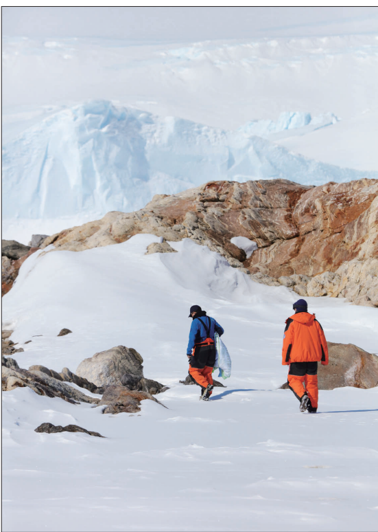
南极中山站越冬队员前往野外进行作业。从上站至今,中国第40次南极考察中山站的越冬队员已经在地球最南端坚守了一年。他们有的进行地磁观测,有的保障一日三餐,有的负责站上通讯……职责不同,但都有一样的信念与使命。如今,队员们在南极的越冬任务即将完成。做好交接后,他们就要踏上回家的路。