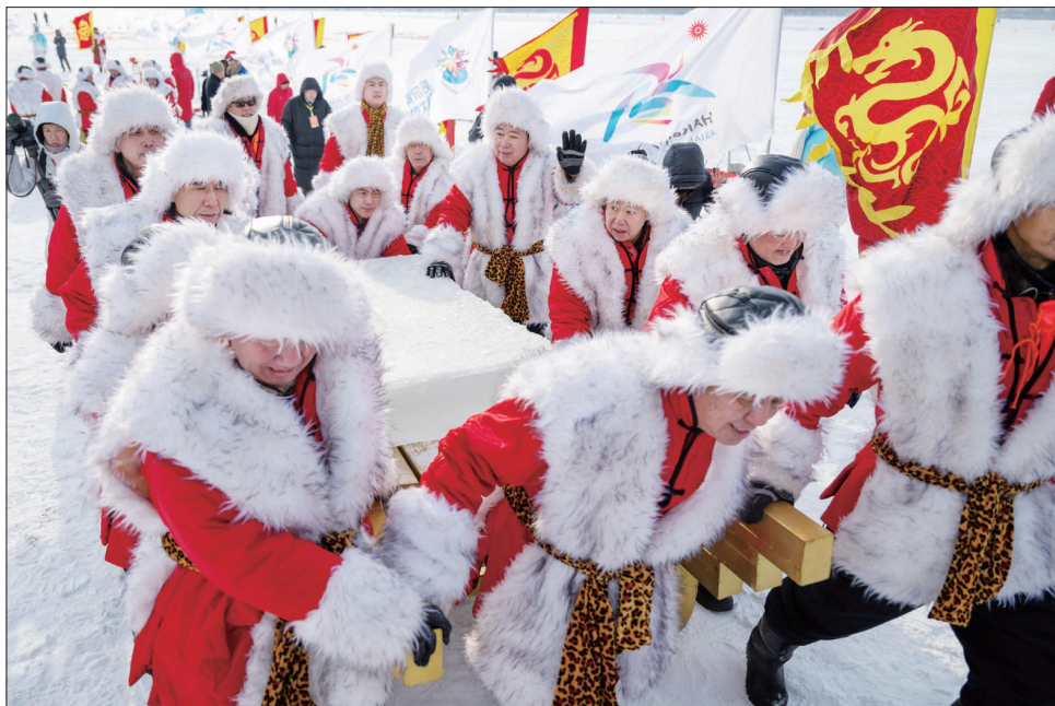
12月7日,在第五届哈尔滨采冰节现场,“采冰汉子”在运送头冰。当日,第五届哈尔滨采冰节在松花江畔开幕,标志着“冰城”哈尔滨进入了采冰季。今年的采冰节以“采头冰·庆亚冬”为主题,精彩的采冰仪式和表演吸引了众多市民和游客参与。