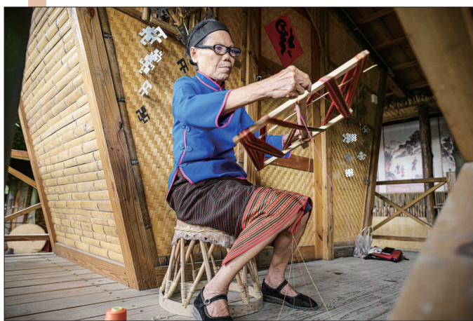
黎族老人在位于海南保亭的槟榔谷文化旅游区展示黎族织锦过程中的绕线工艺。12月5日,正在巴拉圭亚松森举行的联合国教科文组织保护非物质文化遗产政府间委员会第19届常会通过评审,决定将“黎族传统纺染织绣技艺”“羌年”“中国木拱桥传统营造技艺”从急需保护的非物质文化遗产名录转入人类非物质文化遗产代表作名录。