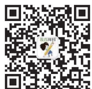
洛阳晚报教育周刊