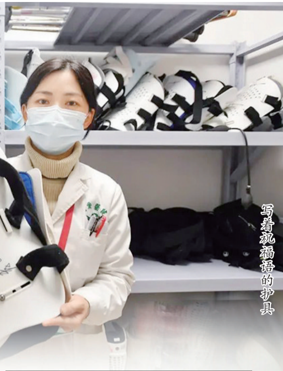
写着祝福语的护具

2022年，武汉市第四医院党委整合资源后，将护具漂流升级为文明实践项目，建设数字化管理共享平台的同时，利用医院优势医疗资源，鼓励捐赠者参与。如今，成功捐赠护具后，捐赠者及其家人可以享受半年内6次免费专家号和绿色通道就医，免费体验康复科、中医针灸科、妇产科等康复治疗服务。