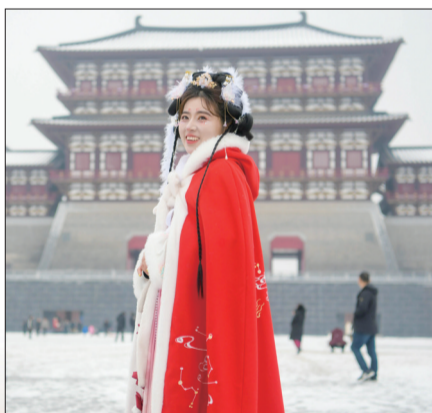
与应天门雪景合影