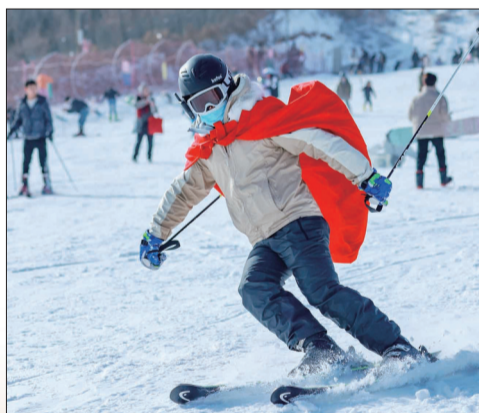
在伊龙国际滑雪场享受滑雪乐趣