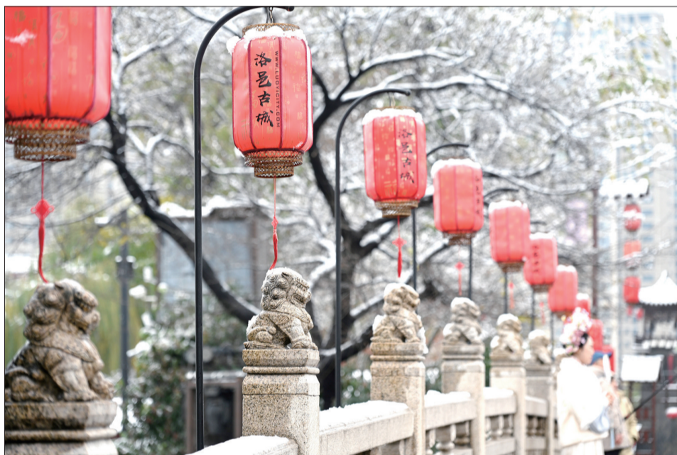
洛邑古城雪景