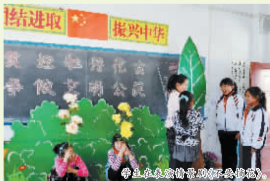
学生在表演情景剧《不要摘花》。