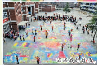
比一比谁的牡丹更漂亮。

4月7日下午,西工区唐宫西路小学的校园里出奇热闹。进入校园一看,场面颇为壮观。480名学生正蹲在地上,用粉笔在操场上绘画;在这些学生的西边,50名学生正趴在课桌上认真用调好的颜料在文化衫上绘图;还有50名学生在多媒体教室里作画;另外800名学生在教室里作画。