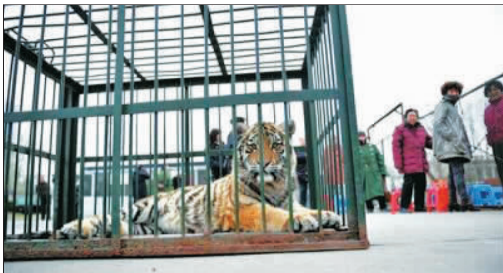
动物园“维权”，拉狮子老虎助威。

郑州市动物园称邻居“借地20多年不还”； 这块地毗邻“郑州酒吧一条街”，寸土寸金