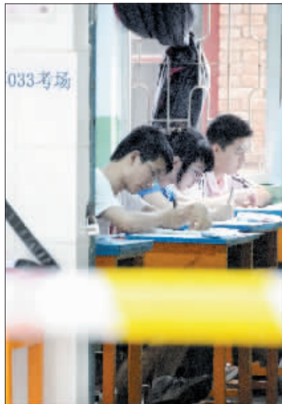
2009年,我市考生参加高考。

也有不少高三老师认为,实行知分填报志愿的新政策,对应届生有好处,因为从历年的估分情况来看,应届生容易出现保守估分,“今年实施这个政策,学生可以量力而行地填报适合自己的高校”。