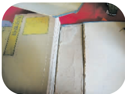
右图 全本《河南通志》