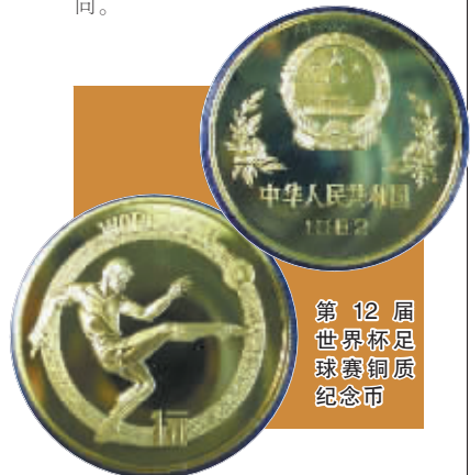
第12届世界杯足球赛铜质纪念币

笔者认为，是金子迟早会发光，目前这枚“世界杯”铜质币已具备了很高的升值潜力，其潜在的投资价值一定会得到广大集币爱好者的认同。