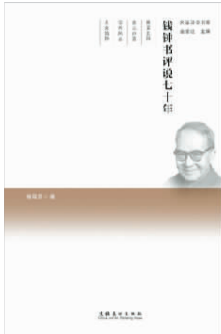
书名:《钱钟书评说七十年》 主编:金宏达 出版社:文化艺术出版社

1938年秋天,日本侵略中国。炮火连天中,北大、清华、南开三所大学南迁西移,在昆明安顿下来一年后,钱钟书先生从欧洲留学回国,经吴宓先生推荐,在西南联大任教。那时他才28岁,风华正茂,是联大外文系最年轻的一位教授。除了担任二年级英文课,他还为三四年级开了一门专题课“文艺复兴”。他讲解一律用英文,总是笑眯眯的,既严肃又幽默。他老是手臂撑在讲台上,有时也离开讲台,在