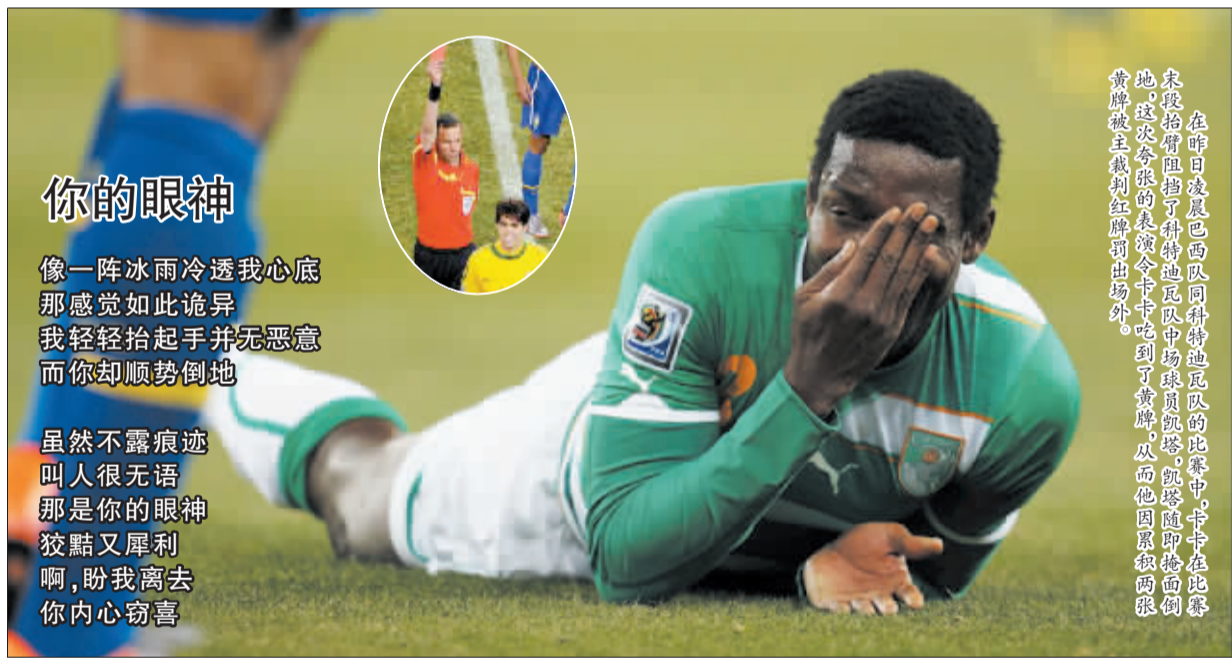
在昨日凌晨巴西队同科特迪瓦队的比赛中，卡卡在比赛末段抬脚阻挡了科特迪瓦队中场球员凯塔，凯塔随即倒地，这次犯规的表演令卡卡吃到了黄牌，从而他因累积两张黄牌被主裁判红牌罚出场外。

——阿根廷队前锋特维斯表示，在下一场对阵希腊队的比赛中，他们将全力以赴，力争“一剑封喉”。