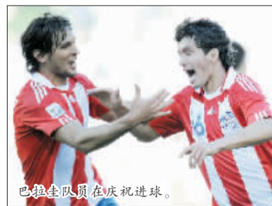
巴拉圭队员在庆祝进球。

翻看以往历史，巴拉圭人打352的时候不少，其实5中场里中场的3位选手退守都非常厉害，加之巴拉圭的边路选手进攻不犀利，防守质量都还不错，很容易就缩成铁桶。但在这场比赛中，贝拉的右路、卡塞雷斯的中路、里韦罗的左路在站位上都