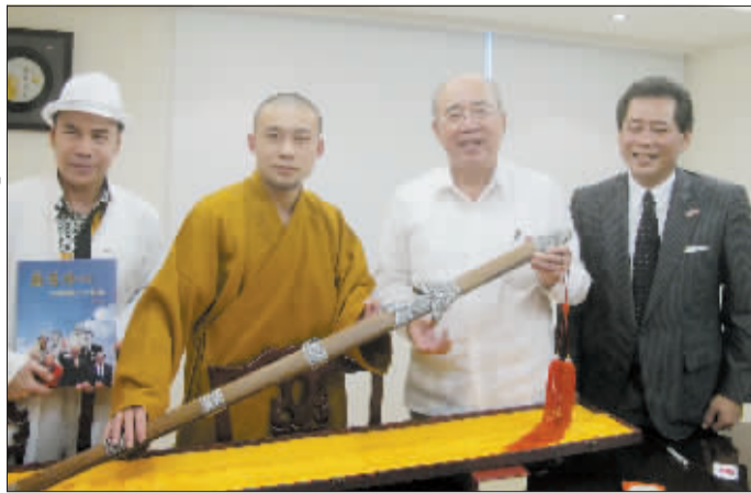
吴伯雄(右二)获赠“龙泉宝剑”。

“欢迎欢迎,欢迎来自河南洛阳的朋友!” 昨日下午4时许,在台北市开封街的“伯仲文教基金会”,中国国民党荣誉主席、世界客属总会总会长、台湾客家演艺文化协会荣誉总会长吴伯雄先生,亲切会见了洛阳杂技团武术队的部分队员。