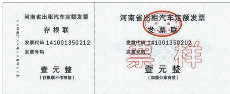
新版出租车定额发票