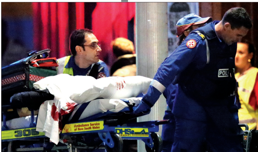
12月16日,救护人员与警察推着没有血迹的担架