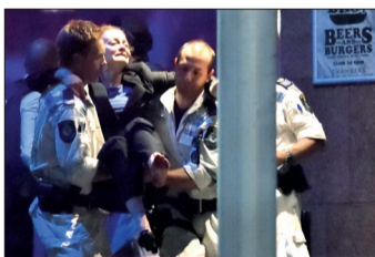
一名受伤人质被抬离咖啡馆