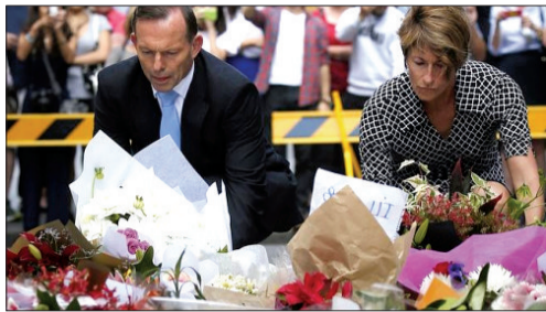
澳大利亚总理阿博特和夫人献花悼念