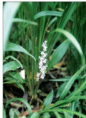
(线索奖三十元)

吉祥草自古被看成是神圣的草,是宗教仪式中不可缺少之物。吉祥草名称的由来,有的说是释尊在菩提树下悟道时,敷此草而坐;或说此草乃吉祥童子为释尊所铺之座;也有说是有一位名为吉祥者的人,献上这种草给释尊。