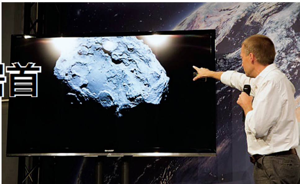
科学家在讲解“罗塞塔”传回的图像

美国《科学》杂志近日公布了其评出的2014年十大科学突破,这是对全球科学研究每年一度的年终盘点,人造探测器首次登陆彗星被选为本年度最重要的科学突破。