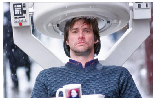
《暖暖内含光》电影剧照

IBM领导的一项研究首次推出大规模“神经形态”芯片,它们以类似人脑的方式来处理信息。