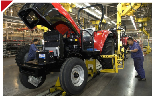
中国一拖具有领先科技水平的大轮拖拉机出口装竣