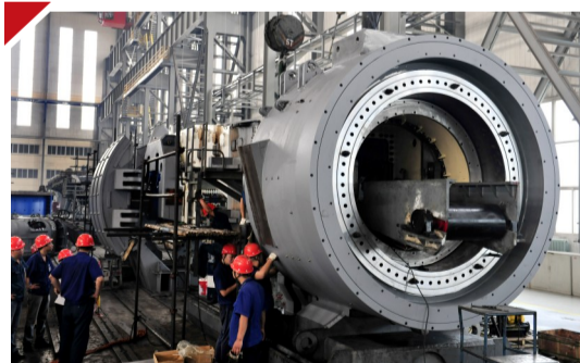
国内首台直径5米硬岩掘进机在中信组装生产