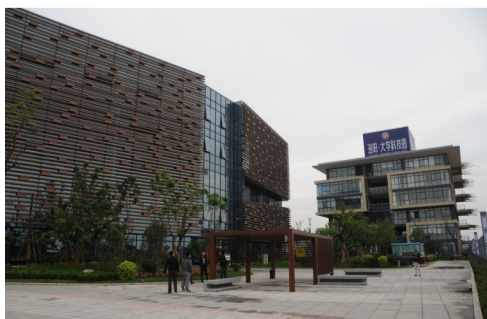
洛阳国家大学科技园