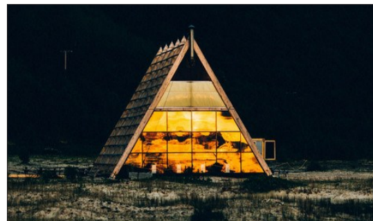
世界上最大的桑拿房 (网络图片)

一家名为SALT的文娱活动组织机构在挪威北部位于北极圈内的一个僻静小岛上建起了这座桑拿房,可容100多人同时“蒸”。房子呈人字形,内部像阶梯礼堂,有4个桑拿炉。人们可以边坐在阶梯上蒸桑拿,边隔着巨大的落地窗欣赏北冰洋风光,享用酒吧提供的各类饮品,欣赏优美的音乐。桑拿房开到今年9月,成人门票175挪威克朗(约合133元人民币),儿童90挪威克朗(68元人民币)。