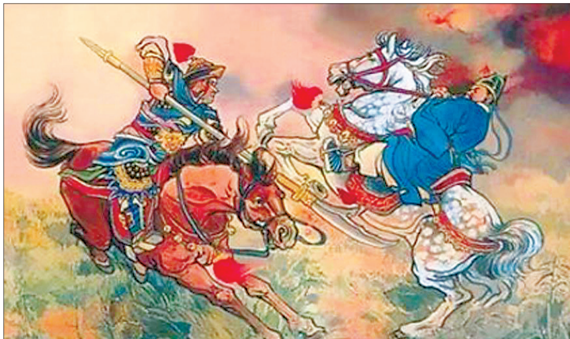
连环画《火烧陈友谅》 (资料图片)