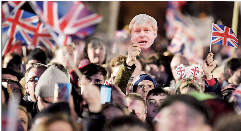
1月31日,在英国伦敦,一名“脱欧”支持者手举英国首相鲍里斯·约翰逊的面具在英国议会广场参加庆祝活动

待“脱欧”时刻。夜间,政府建筑物点亮红色、白色和蓝色灯光,“脱欧”倒计时钟投射在首相官邸。