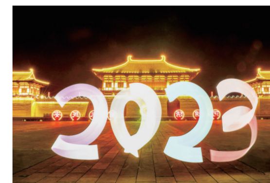
2022年12月31日晚,摄影爱好者在定鼎门广场用灯光绘出“2023”字样迎接新年