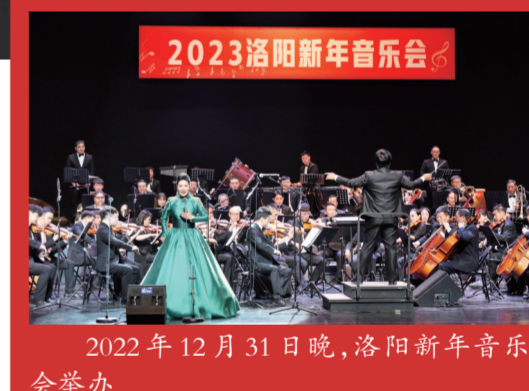
2022年12月31日晚,洛阳新年音乐会举办