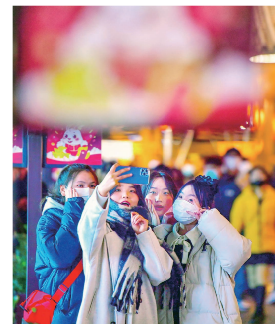
2022年12月31日晚,在西工小街,前来“打卡”的游客络绎不绝