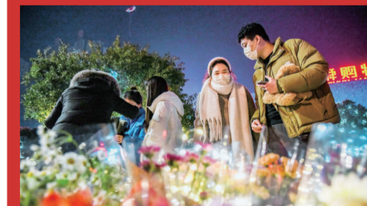
2022年12月31日晚,市民在泉舜购物中心广场挑选鲜花