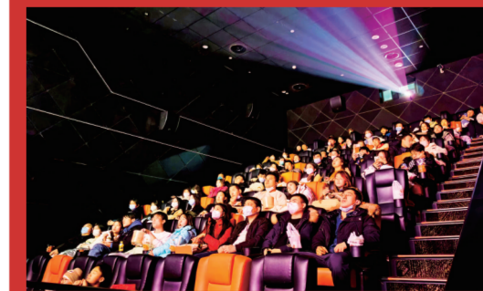
2022年12月31日晚,不少市民在洛阳正大乐影城观影