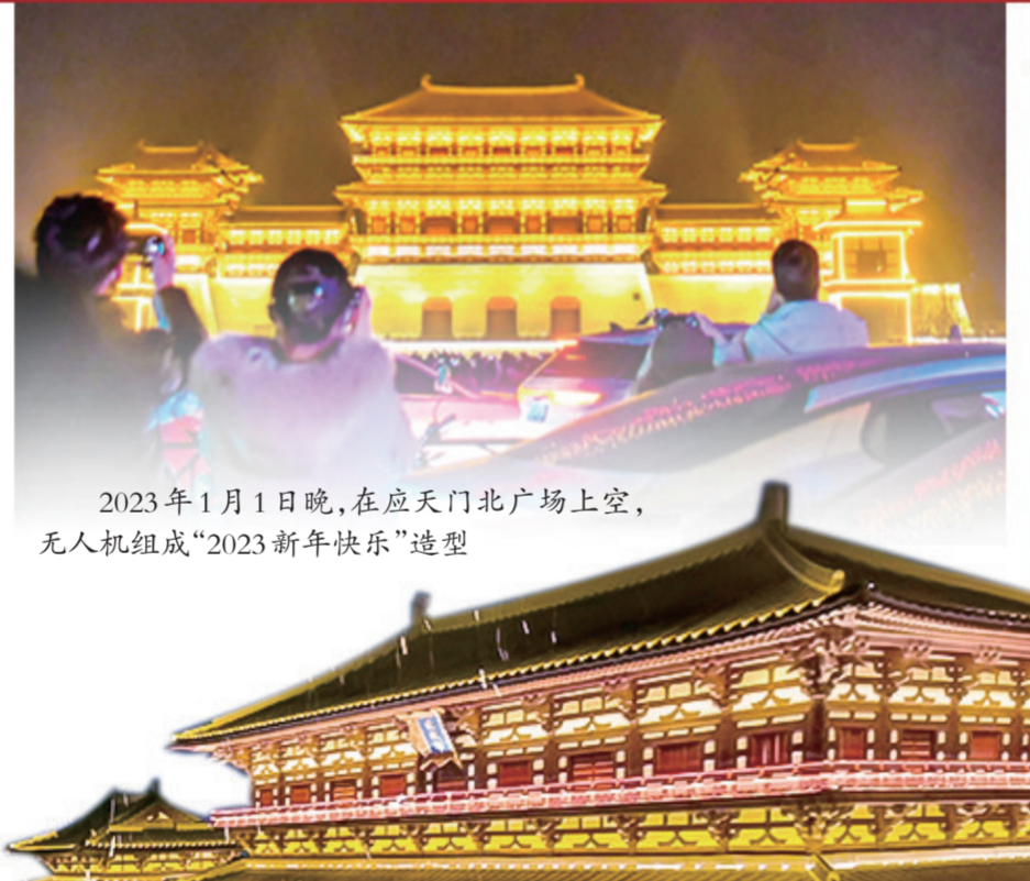
2023年1月1日晚,在应天门北广场上空,无人机组成“2023新年快乐”造型