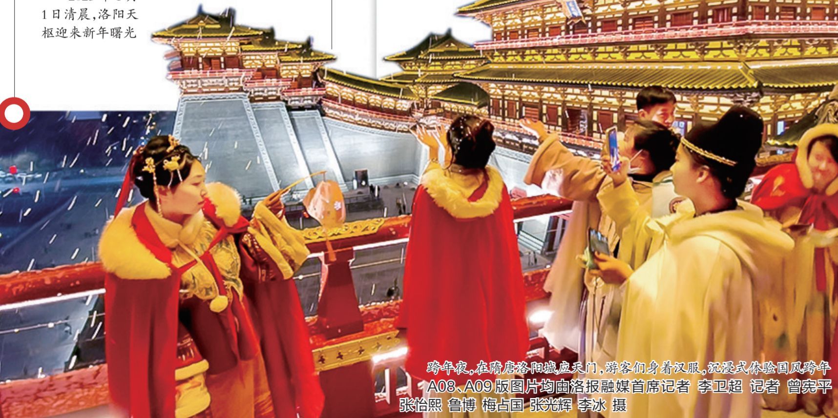
跨年夜,在隋唐洛阳城应天门,游客们身着汉服,沉浸式体验国风跨年