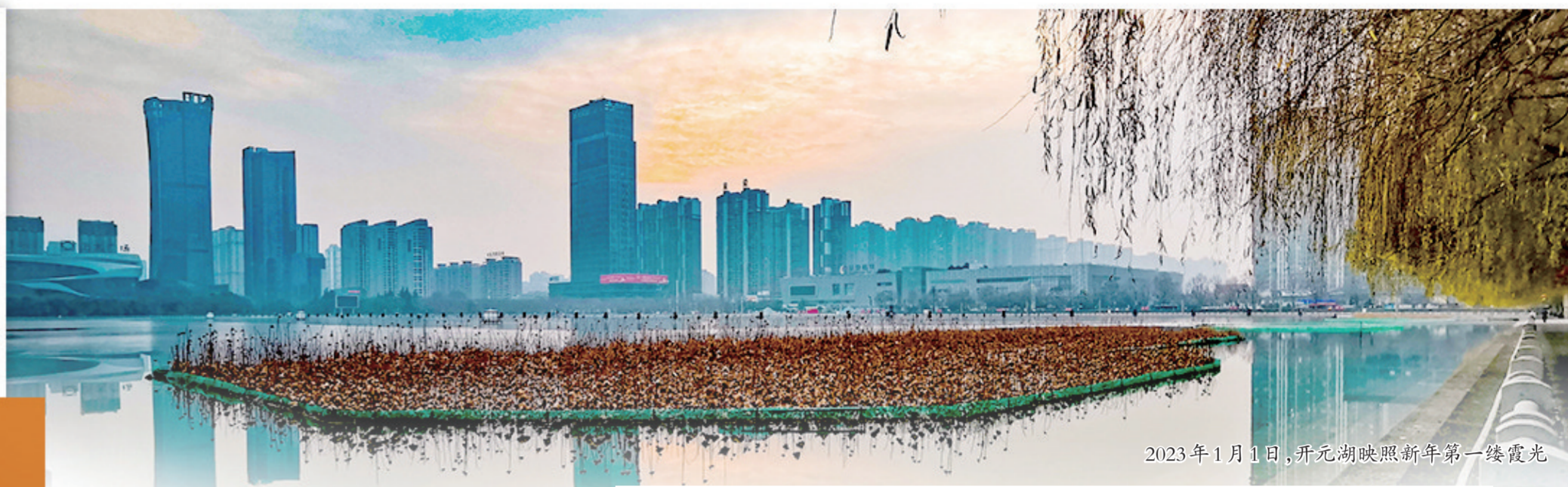
2023年1月1日,开元湖映照新年第一缕霞光

日月其迈, 岁律更新, 岁月赋予了时光一个崭新的名字:2023! 从“2022”到“2023”, 是数字的飞跃, 也是时间的延续。 一句充满仪式感的“新年好”, 既饱含着对一年的期许与希望, 也意味着过去一年征途中的艰辛、拼搏中的汗水, 都将化为逐梦前行的奋进之力, 激励着我们在继往开来中实现新的跨越。 新年第一天, 尽现新气象。 放眼河洛大地, 蓝图绘就、征途如虹、前路浩浩荡荡, 时代的号角正在回响, 让我们迎着2023年的第一缕阳光, 拥抱新的开始、拥抱新的希望, 开启新年新征程。 身边有很多人, 走过风风雨雨、越过沟沟坎坎, 才更加懂得奋斗的价值、人生的意义。 因为我们知道, 穿越寒冬的荆棘终会看见春暖花开, 我们也一直相信, 春天终将回馈每一个在冬天里的抱薪者、坚守者、发光者。 你看这气象万千的洛阳, 龙门石窟“千机璀璨”奏新篇, 隋唐洛阳城“天门初雪”迎新年, 大街小巷的“烟火气”让年味浓了起来。 岁月不居、芳华有信, 我们栖息于洛阳这片土地, 能够在每个寻常日子里, 目睹着国的兴盛、家的福泽, 感受着脚下的支撑、身边的温度。 我们更加坚信:涓涓细流终将汇成澎湃浪潮。 每一个为美好生活奋力奔跑的人, 都是国家向上生长的力量。 让我们以奔跑、奋进、搏击去赢得美好未来, 让我们永远坚定、永怀信心、永葆乐观。 你好,2023! 你好,洛阳!