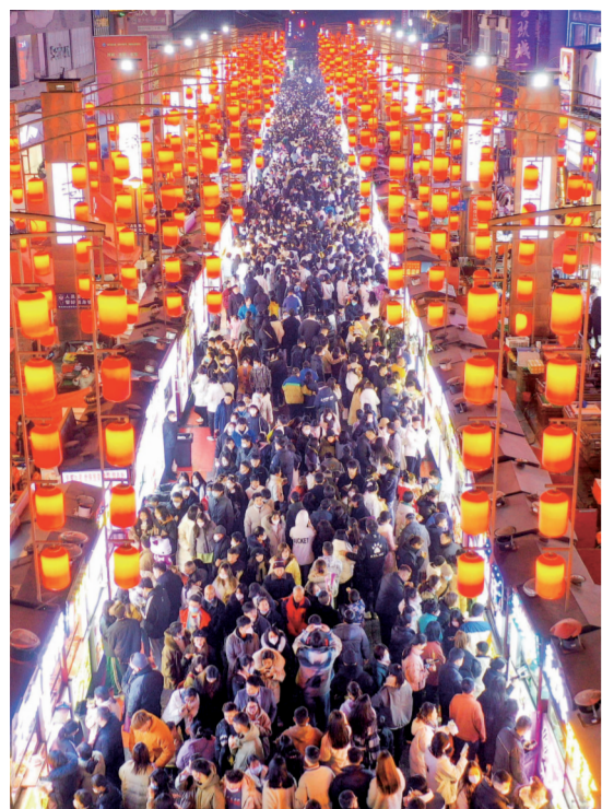
2022年12月31日晚,不少游客在老城十字街品味美食,感受古都“夜魅力”