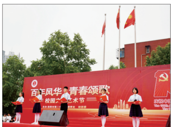
精彩纷呈的校园文化艺术节