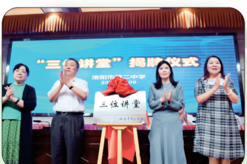
学校于2022年9月开展“三位讲堂”系列活动