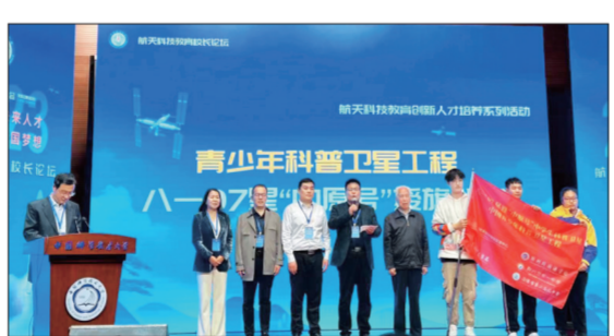
“中原号”科普卫星八一-07星正式授牌，二高加入全国航天教育联盟