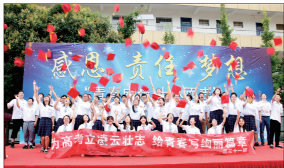
成人礼活动让学生梦想起航