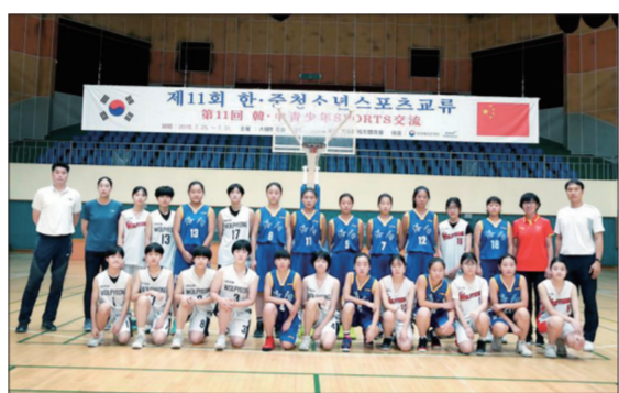
学校女篮荣获河南省校园篮球联赛亚军